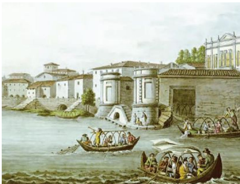
Veduta di Lesa , stampa degli inizi del XIX secolo, particolare; sulla destra l'imbarcadero e la facciata di Villa Stampa