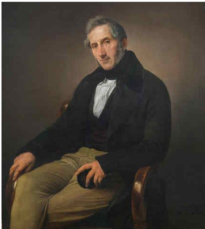
Francesco Hayez, ritratto di Alessandro Manzoni, 1841